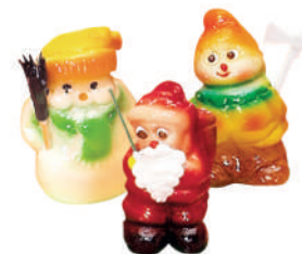
Personnages de Noël assortis en boîte individuelle transparente (tubo) Marzipan christmas figurines (individual box) B4838 ..... (52 à 58g) ..... Cdt : 24pcs/1.32kg