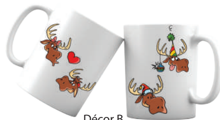
Décor B Recto & Verso

AMUGRENBO - Mug décor A BMUGRENBO - Mug décor B Mug garni de boules de neige (céréales chocolat blanc) (120g) Cdt : 6pcs / 720g