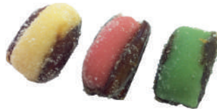
Dattes assorties 3 parfums Assorted filled dates B3330 ..... (13-16g) ..... Cdt : 2kg