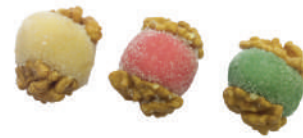
Noix assorties 3 parfums Assorted filled walnuts B3320 ..... (13-16g) ..... Cdt : 2kg