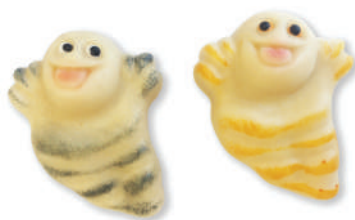
Fantôme en pâte d'amandes Bulk marzipan ghost FANTOME ..... (25g) ..... Cdt : 30 pcs /750g