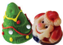
Sapin et Père Noël en pâte d'amandes Assortment of marzipan Christmas trees and Santa Claus 12NOEL01 ..... (38g) ..... Cdt : 24 pcs/ 912g