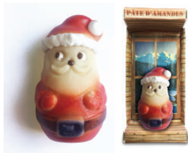
Père Noël en pâte d'amandes en coffret individuel Individual box of marzipan Santa Claus BOXPN ..... (30g) ..... Cdt : 15 pcs/ 450g