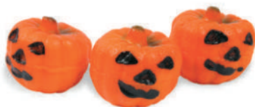
Petites citrouilles en pâte d'amandes Bulk marzipan little pumpkins 01HAL21 ..... (25g) ..... Cdt : 100pcs 2,5kg