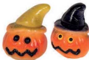
Petites citrouilles chapeau en pâte d'amandes Bulk marzipan little pumpkins with hat 16HAL ..... (25g) ..... Cdt : 35 pcs/875g