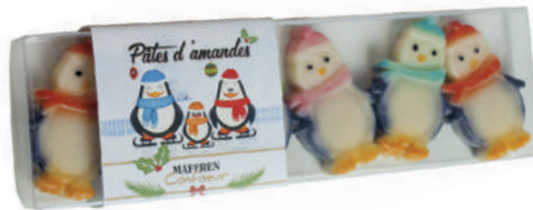
Réglette assortiment pingouins en pâte d'amandes Strip box with assortment of marzipan penguins REGPING ..... (70g) ..... Cdt : 10 pcs/ 700g