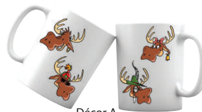
Décor A Recto & Verso

Mug Rennes garni de confiseries (2 décors possibles) Mug of sweets - Reindeer