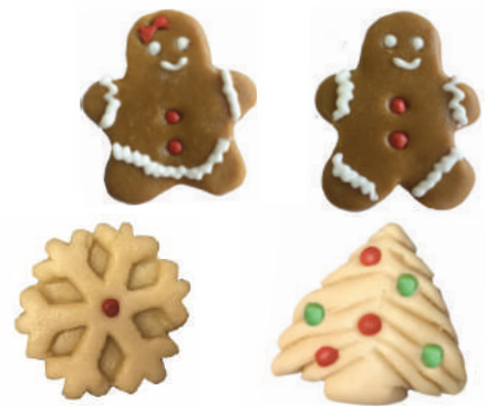
Assortiment «marché de Noël» en pâte d'amandes sous flowpack Assortment of wrapped marzipan christmas items 19ASSNOEL ..... (16-20g) ..... Cdt : 24 pcs/ 408g