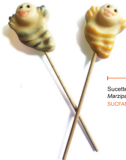
Sucettes Fantômes en pâte d'amandes Marzipan ghost lollipops SUCFANT ..... (25g) ..... Cdt : 24 pcs/600g