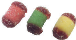
Bigarreaux assortis 3 parfums Assorted filled cherries B3350 ..... (14-16g.) ..... Cdt : 2kg