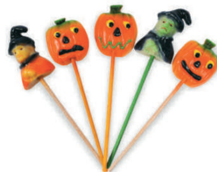
Sucettes Halloween en pâte d'amandes Marzipan halloween lollipops 01HAL22 ..... (40g) ..... Cdt : 36 pcs /1,44kg