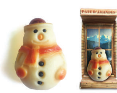
Bonhomme de Neige en pâte d'amandes en coffret individuel Individual box of marzipan snowman BOXBN ..... (30g) ..... Cdt : 15pcs/ 450g