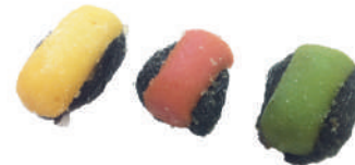
Pruneaux assortis 3 parfums Assorted filled prunes B3340 ..... (13-16g) ..... Cdt : 2kg